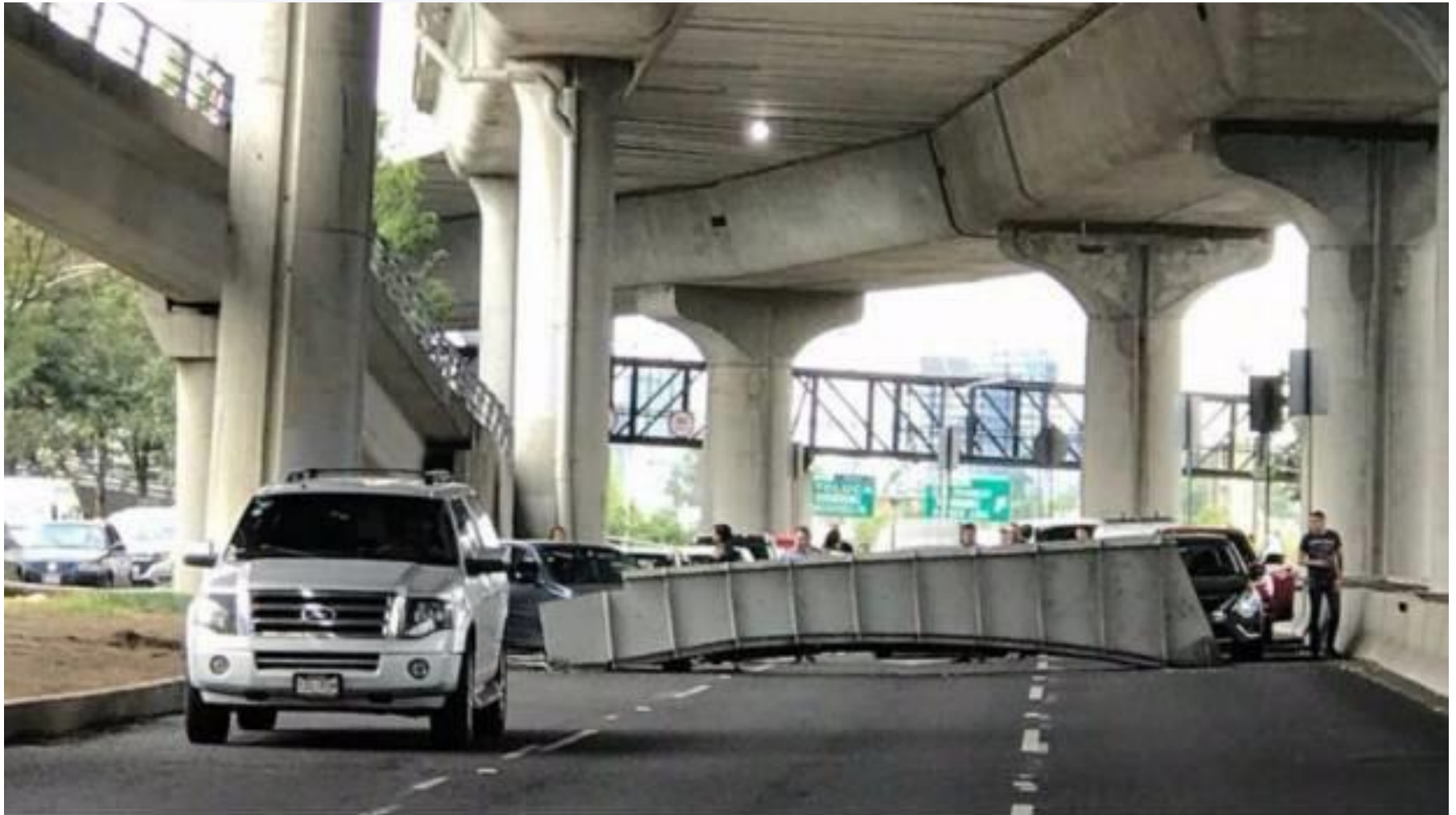
Caída de cimbra de trabe. Segundo Piso Periférico Norte. 16 agosto 2017