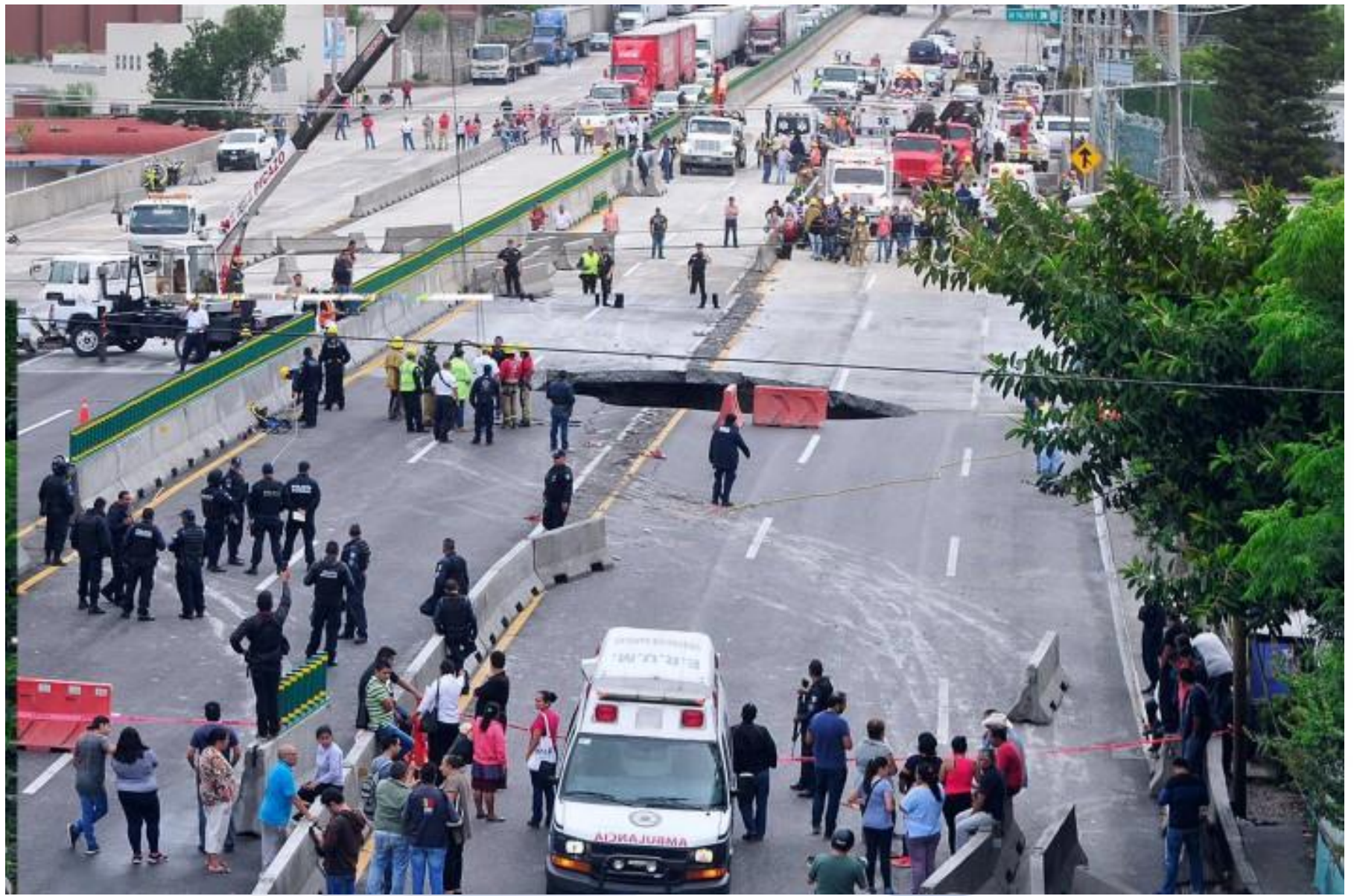
Socavón en Paso Express Cuernavaca. 12 de julio de 2017